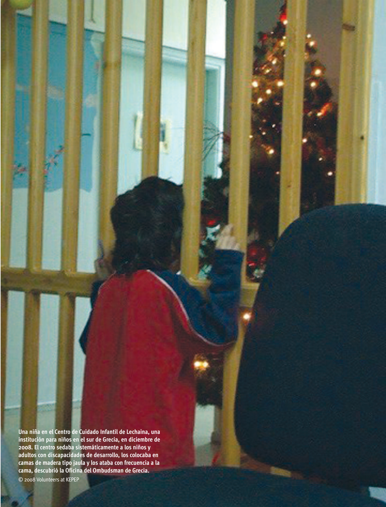
Una niña en el Centro de Cuidado Infantil de Lechaina, una institución para niños en el sur de Grecia, en diciembre de 2008. El centro sedaba sistemáticamente a los niños y adultos con discapacidades de desarrollo, los colocaba en camas de madera tipo jaula y los ataba con frecuencia a la cama, descubrió la Oficina del Ombudsman de Grecia.