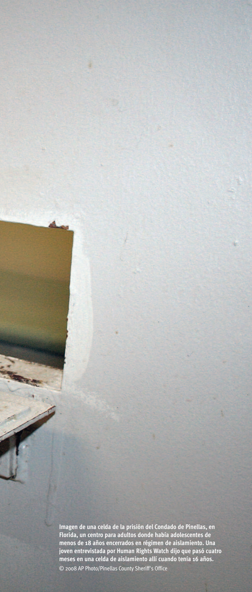
Imagen de una celda de la prisión del Condado de Pinellas, en Florida, un centro para adultos donde había adolescentes de menos de 18 años encerrados en régimen de aislamiento. Una joven entrevistada por Human Rights Watch dijo que pasó cuatro meses en una celda de aislamiento allí cuando tenía 16 años.